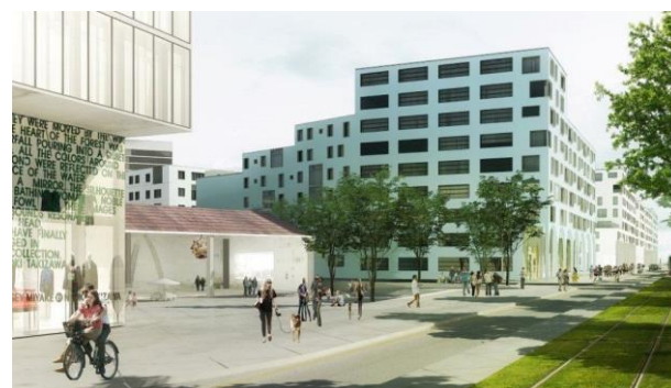
Images du projet - AUC